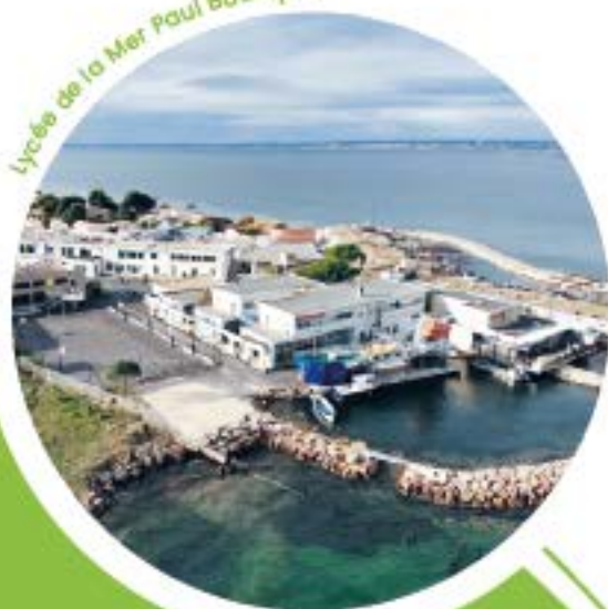
Lycée de la Mer Paul Bousquet

20H : Repas ou Buffet pour les arrivées tardives.